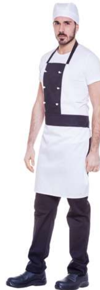
E001 Grembiule Pizzaiolo Unisex