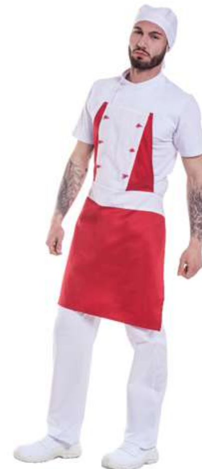
E002 Grembiule Pizzaiolo Unisex

Fascia in vita rinforzata e 2 lacci lunghi da cm 125 6 bottoni antipanico 65% poliestere - 35% Cotone da 170 gr. mq Non restringe e scolora al lavaggio Prodotto certificato OEKO-TEX Lavabile a 60 gradi Produzione Italia - Marca: Chef Italy