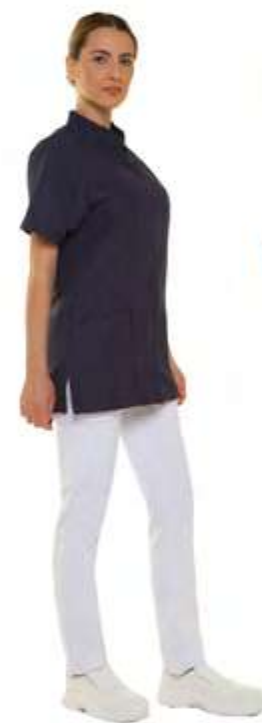
08 - Nero