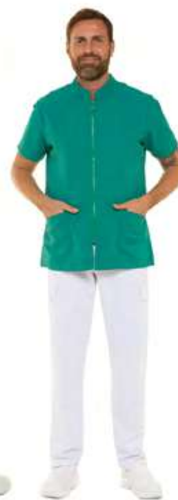
09 - Verde